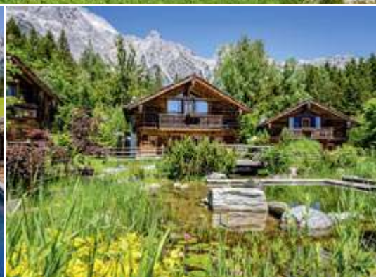
Das neue Priesteregg Bad mit großzügiger Holzterrasse und dem Himmel-Pool wurde unterhalb der Chalets in den Hang hineingebaut und ist ein Musterbeispiel für nachhaltige Architektur.