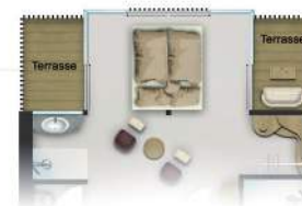
OG Variante Schlafen